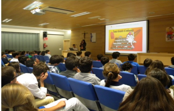
Colegio Nª Sra. del Recuerdo

Un total de alrededor de 500 alumnos de la ESO, de los Colegios Nuestra Sra. de las Maravillas, Nuestra Señora del Recuerdo de los Padres Jesuitas y el Colegio Alemán de Madrid en edades comprendidas entre los 11-15 años, asistieron en el transcurso del año 2014 a las Charlas sobre Prevención del Tabaquismo en la Adolescencia que la Fundación imparte en los colegios de Madrid.