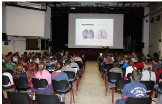
Colegio Alemán de Madrid