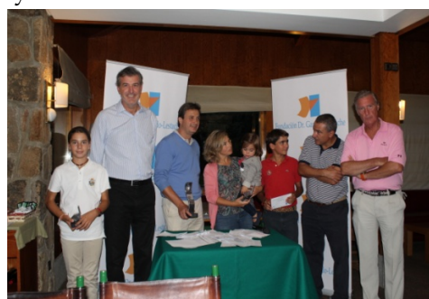
Los premiados con los directivos del Club y de la Fundación.

Al finalizar el torneo, que fue organizado en colaboración con el propio Club de Campo, tuvo lugar el acto de entrega de premios en la casa club, con premios para los mejores clasificados de primera y segunda categoría (damas y caballeros) así como para el drive más largo y golpe más cercano, seguido de un gran sorteo entre todos los participantes. En la foto: los premiados con los directivos del Club y de la Fundación.