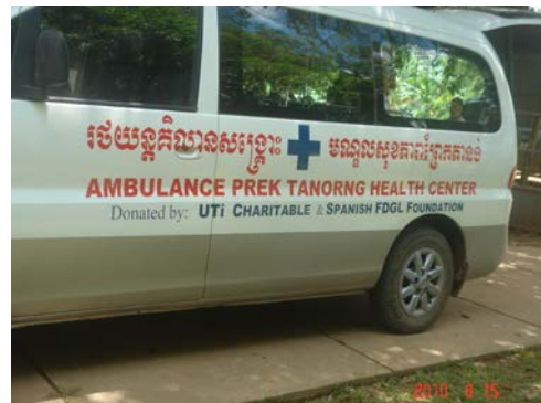
Ambulancia donada por la Fundación