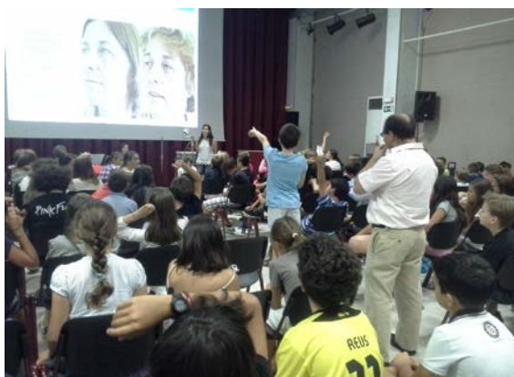
Colegio Alemán (septiembre de 9 de 2013)

Un total de más de 1.000 alumnos de la ESO de los Colegios Maravillas, Nuestra Señora del Recuerdo de los Padres Jesuitas, Colegio Alemán y el Instituto Ramiro de Maeztu en edades comprendidas entre los 11-15 años, han asistido en el transcurso del año 2013 a las Charlas