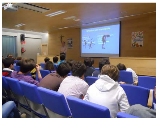
Sesión en el Colegio Nuestra Señora del Recuerdo de los Padres Jesuitas en el año 2012

Un total de más de 1.000 alumnos de la ESO de los Colegios Maravillas, Nuestra Señora del Recuerdo de los Padres Jesuitas, Colegio Alemán y el Instituto Ramiro de Maeztu en edades comprendidas entre los 11-15 años, han asistido en el transcurso del año 2013 a las Charlas