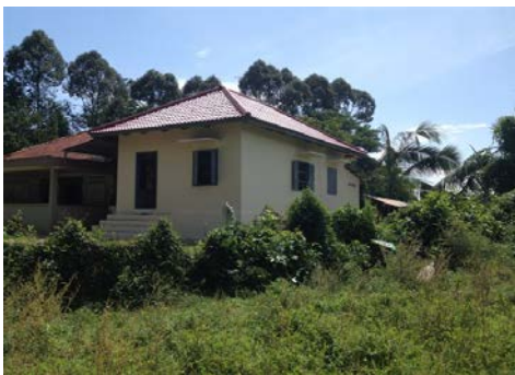
Vista externa del Área de Maternidad

En el nuevo local, que esta atendido por un equipo formado por 6 enfermeras a demás de comadronas y personal de apoyo, se ofrecen, también, servicios de consultas externas de ginecología, chequeos médicos y supervisión durante el embarazo.